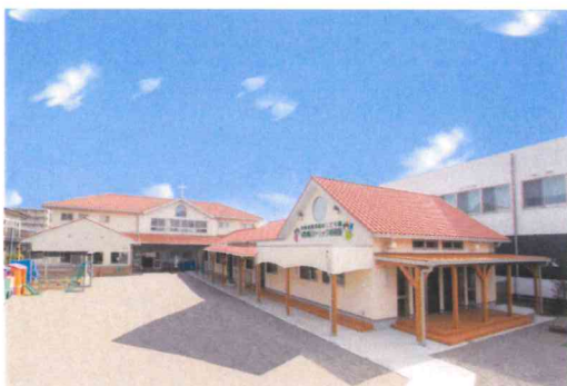
南宮崎カトリック幼稚園