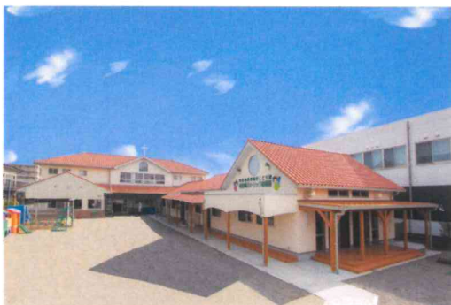
南宮崎カトリック幼稚園